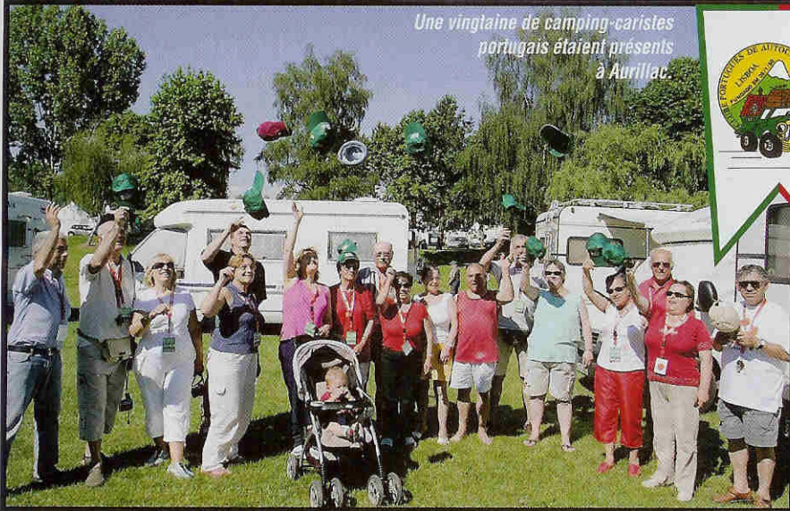
Une vingtaine de camping-caristes portugais étaient présents à Aurillac.